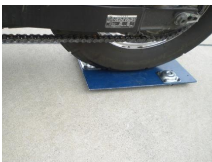
後輪が乗り込んだ状態