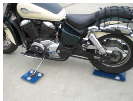
サイドスタンドにもボードを敷く