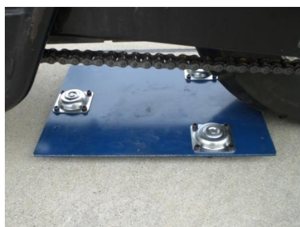
ボードは薄いので乗り込みが容易